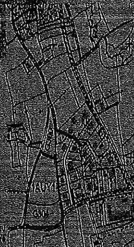
Localisation du parc d'activités de Courcelles